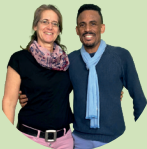
Caruso & Akala: Ernährung